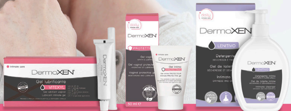
VITEXYL lubricant gel