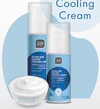
Σειρά Body Care