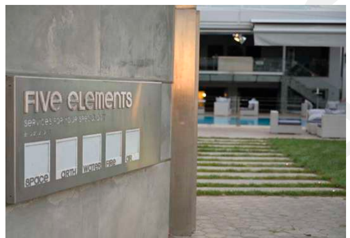
Ο χώρος που φιλοξένησε τα Best in Pharmacy Awards 2020

Η Ελληνική Εταιρεία Φαρμακευτικού Management (E.E.Φα.Μ) που έχει ως έργο της την ενδυνάμωση και ανάπτυξη των στελεχών στο χώρο της Υγείας και Ευεξίας, στηρίζει με θέρμη κάθε προσπάθεια ανάδειξης του σημαντικού τους έργου».