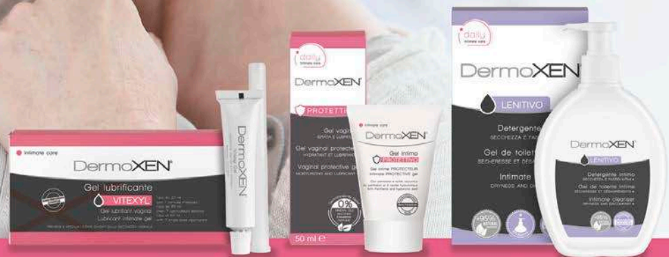
VITEXYL lubricant gel