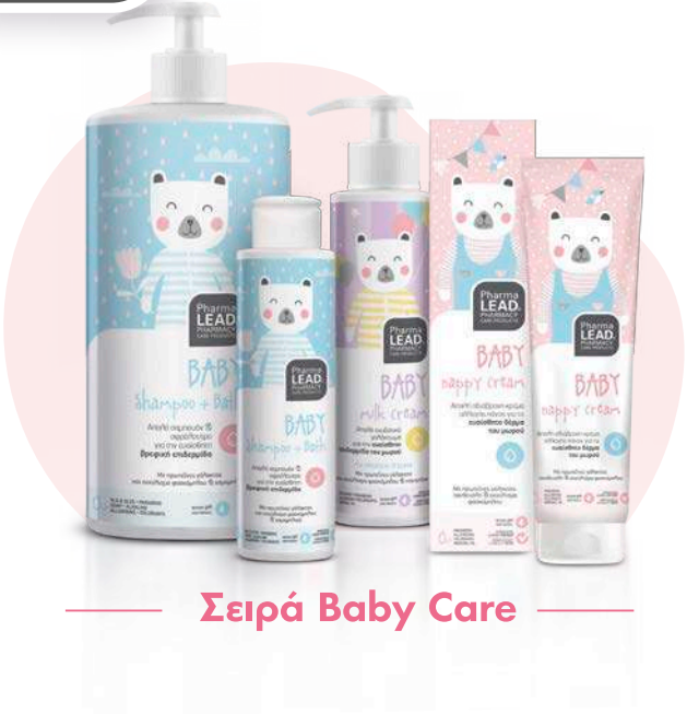
Σειρά Baby Care